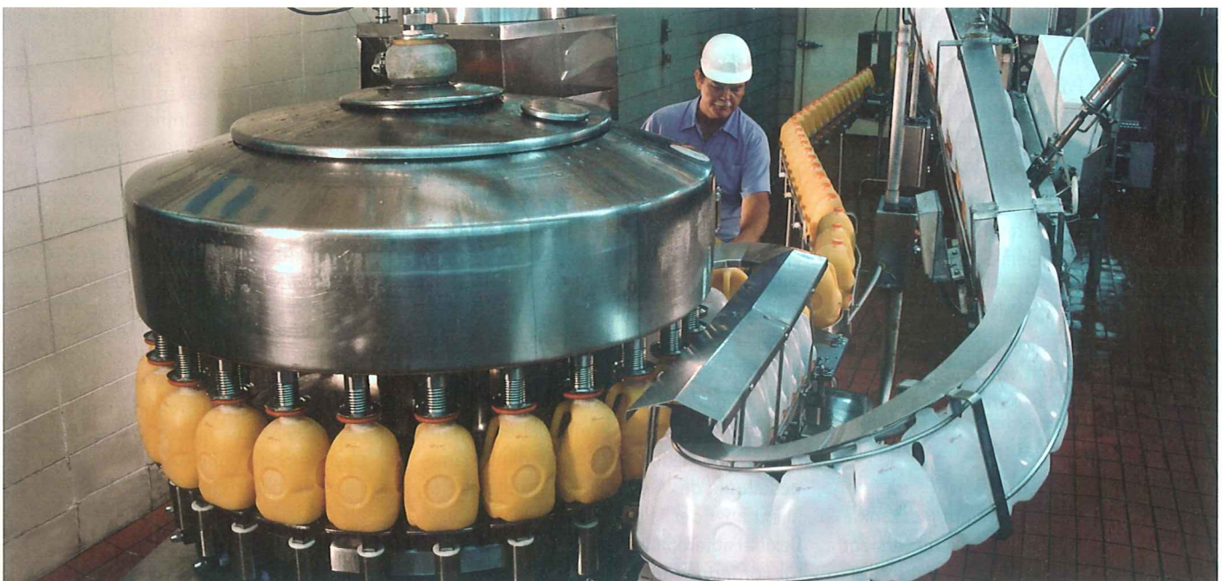
Die Finanzmarktkrise hat auch die Kapitalmarktfinanzierung des Mittelstands in Mitleidenschaft gezogen. Die Stunde schlägt dadurch einmal mehr den Sparkassen-Beteiligungsgesellschaften.

Ähnlich war es wenig zuvor der Conpair AG ergangen. Sie war Mitte 2007 mit dem Programm SME Growth gestartet, das bereits Ende 2007 mit Hilfe von Lehman Brothers platziert werden sollte. Als Folge der Subprime-Krise war dies nicht möglich. Der neugefundene Anker-Investor ACP Capital wurde Ende Juli 2008, wenige Tage vor Auszahlung, von Hedge Fonds übernommen. Seitdem ist ▶